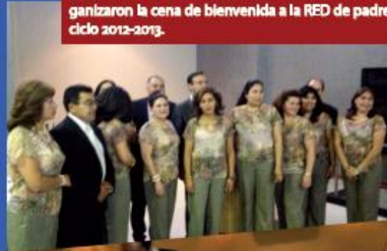
Con gran entusiasmo los matrimonios que conforman la mesa directiva de la Comunidad de Padres de Familia organizaron la cena de bienvenida a la RED de padres del ciclo 2012-2013.