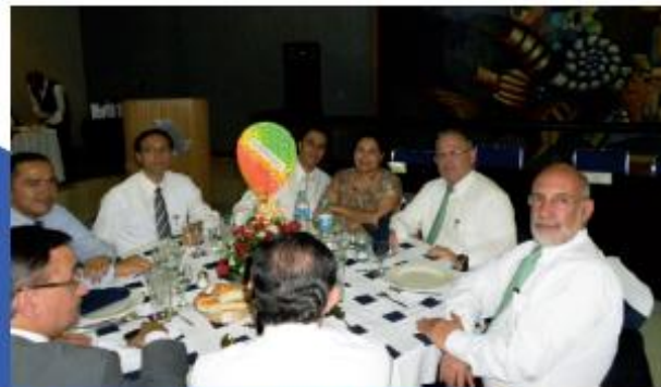
Los directivos de la preparatoria de la Universidad La Salle y los coordinadores generales de la Comunidad de Padres de Familia asistieron gustosos a la cena de bienvenida de la RED de padres de para el ciclo 2012-2013.