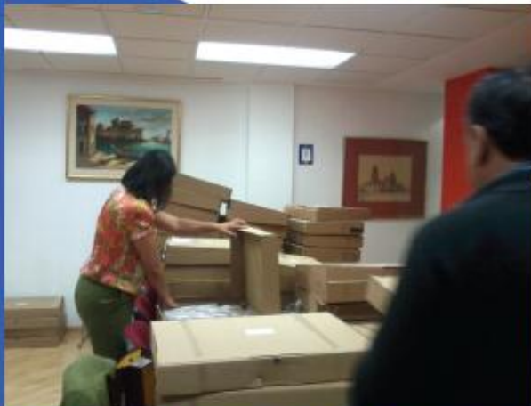
Para repartir poco más de 3000 panes y jugos fue necesaria la colaboración de alumnos, padres y directivos