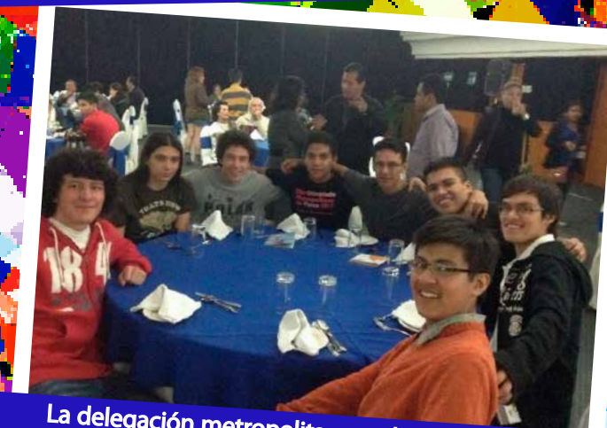
La delegación metropolitana en la xxv Olimpiada Nacional de Física

En los jóvenes está el futuro de la ciencia, y en éste, el progreso humano. Asistir a un ejercicio como la xxv Olimpiada Nacional de Física no me podría hacer menos que reflexionar ante la veracidad de dicha expresión. Cien jóvenes reunidos, todos extraordinarios en su campo, todos dispuestos en un ejercicio académico para el conocimiento de la física.