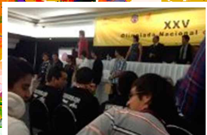
Premiación y clausura de la XXV Olimpiada Nacional de Física