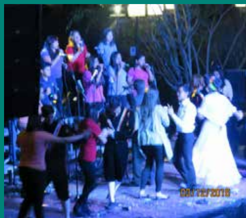
Talento, alegría y convivencia en comunidad fue el condimento principal de la Noche Colonial.