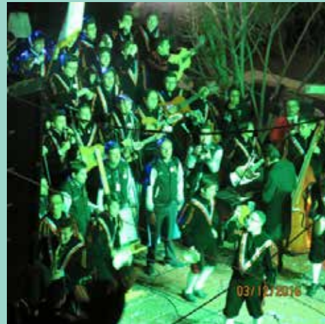
Derroche de talento, alegría y emoción fue lo que desbordaron los integrantes de la Estudiantina de la Universidad La Salle en cada una de sus presentaciones.