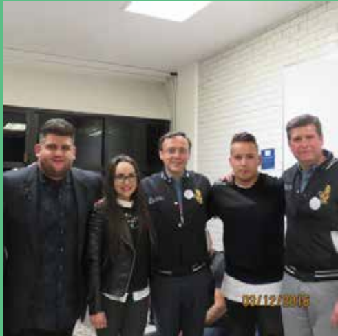
El grupo Matisse fue el encargado del show estelar por el festejo de la XLV Noche Colonial.