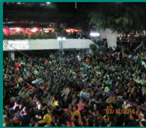
Una verdadera multitud se congregó en Plaza La Salle desde temprano y hasta altas horas de la noche para presenciar a los diferentes grupos y estudiantinas.