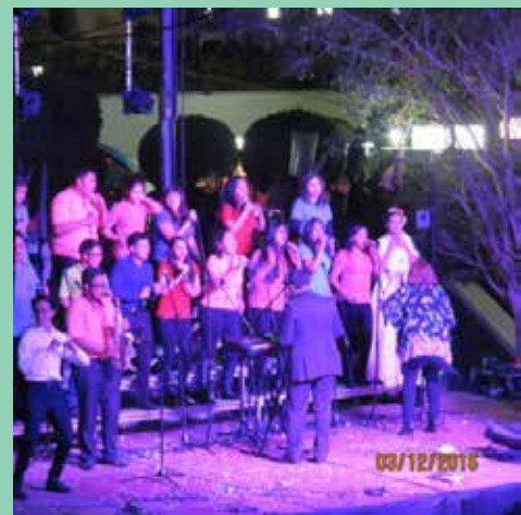
Cientos de grupos y estudiantinas de diversas escuelas se presentaron durante todo el día en la XLV Noche Colonial.