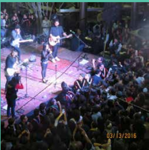
Gran expectativa y furor causó la presentación del grupo Matisse entre los miles de asistentes para esta gran noche.