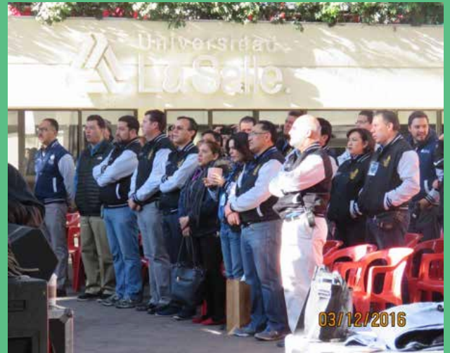
En la misa estuvieron las autoridades de la Universidad y la Escuela Preparatoria al igual que los miembros de la Comunidad de Padres de Familia.

El pasado 12 de marzo se llevó a cabo la XLV Noche Colonial con un éxito arrollador. Como cada año, se comenzó con una misa, para posteriormente dar el platillazo inaugural. Hubo de todo: juegos mecánicos, antojitos, suvenires, y lo más representativo del evento, la presentación de cientos de estudiantinas de diversas partes de la ciudad de México y de los estados de la República, lo cual fue sumamente significativo, ya que este año se festeja el 50 aniversario de la Estudiantina de la Escuela Preparatoria y si a eso le aunamos la gran expectativa que causó la noticia de que el artista invitado al evento era el grupo Matisse, todo se conjuntó para que la XLV Noche Colonial fuera un rotundo éxito.