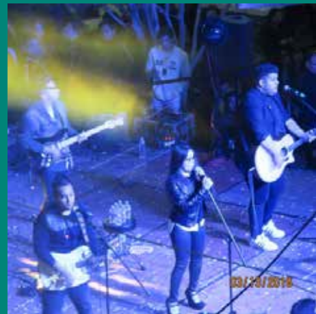
El grupo Matisse supo complacer a sus fans con lo mejor de su repertorio musical, quienes coreaban cada una de sus canciones.