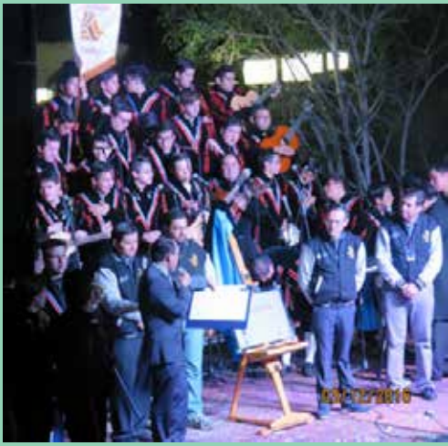
Con gran entusiasmo, y con la presencia de las autoridades, se hizo la develación de la placa del Cincuenta Oniversario de la Estudiantina.